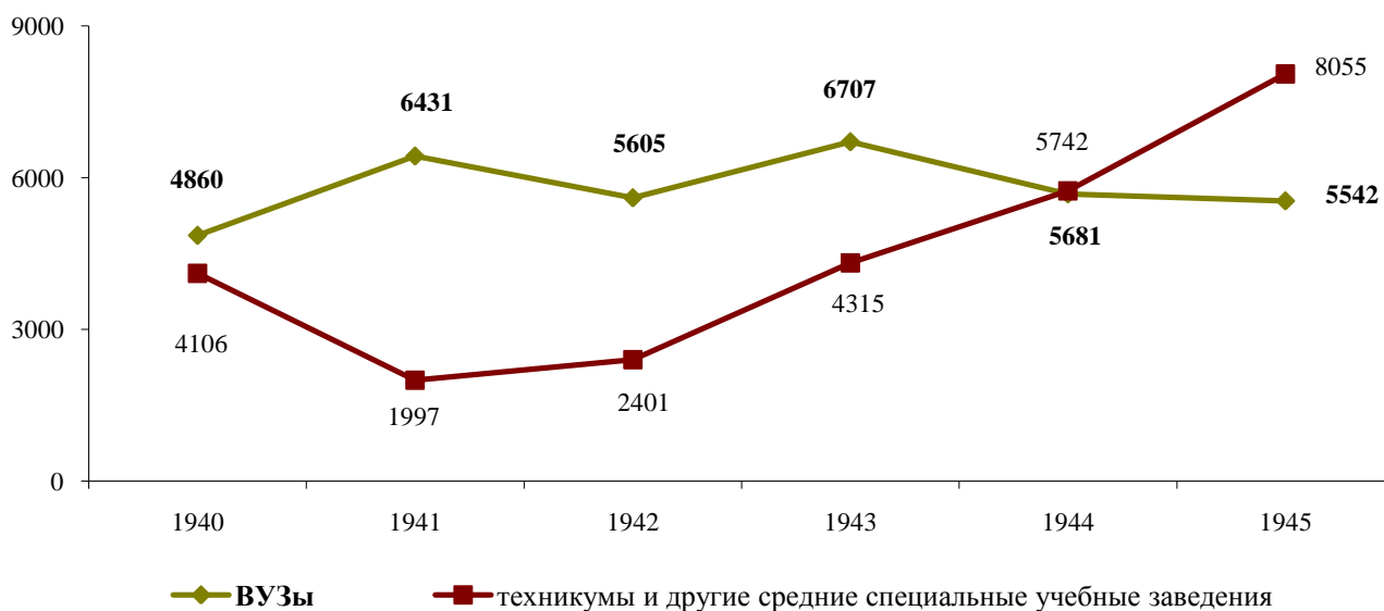
Рис. 18. Численность учащихся в ВУЗах и средних специальных учебных заведениях (человек)

Надежным источником подготовки квалифицированных рабочих кадров стали школы ФЗО – фабрично-заводского обучения. Через них за время войны прошли более 40 тыс. человек, а всеми видами производственного обучения было охвачено более 203 тыс. человек (данные по г. Новосибирску). [13] И нельзя не отметить (еще раз) большую кадровую помощь, которую оказывали студенты и учащиеся народному хозяйству области, совмещая учебу с производственной деятельностью.