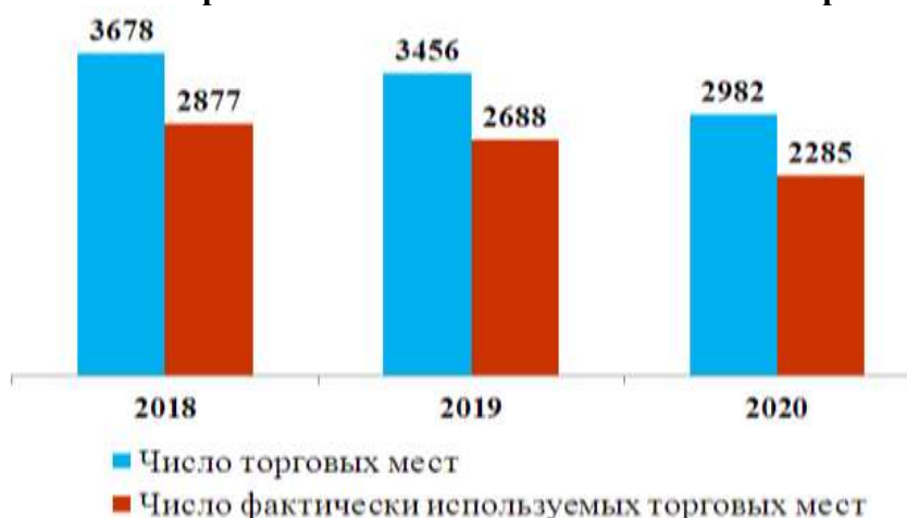
Число торговых мест на розничных рынках Новосибирской области по состоянию на 1 октября

Следует отметить, что доля фактически используемых торговых мест сохраняется на уровне 77-78%.